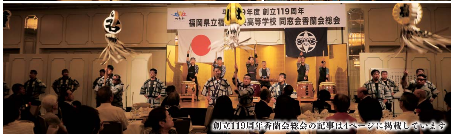
創立119周年香蘭会総会の記事は4ページに掲載しています

発行所 〒810-0014 福岡市中央区平尾3-20-57 福岡県立福岡中央高等学校 同窓会香蘭会 TEL (092)521-7870 FAX (092)791-2811 印刷所 やひろオフィス TEL (092)724-3056