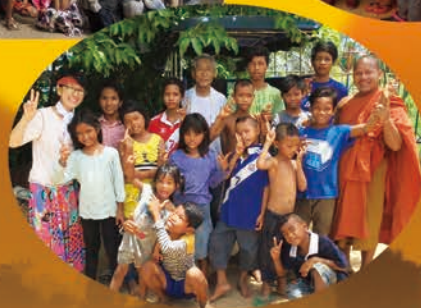
育ての親 ムニ様と一緒に