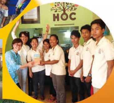
カフェHOCの スタッフ