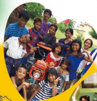
表現豊かな 子ども達